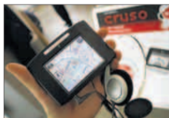
Moderne Zeiten: Das Navigationsgerät Cruso führt zu touristischen Zielen