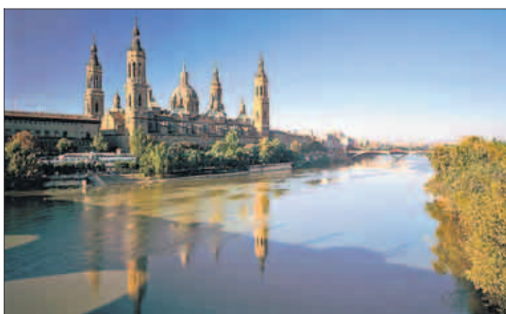
Flusslandschaft mit Kathedrale: die „Basílica del Pilar“ am Ufer des Ebro

Die Expo im Netz www.expozaragoza2008.es